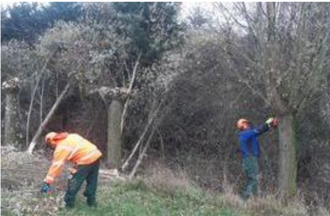
De VAL Oude IJssel werkploeg aan het werk